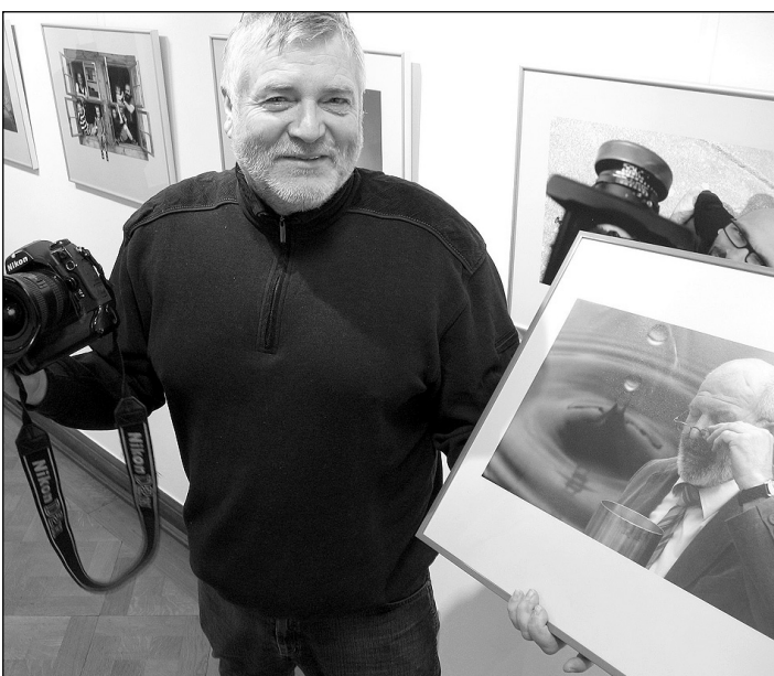
„Der Mensch ist die Dominante.“ Dies zeigt Pressefotograf Roland Obst mit seiner Foto-Ausstellung im Nordhäuser „Kunsthaus Meyenburg.“

Die Besucher erwarten 80 Aufnahmen, Zeitdokumente, allerdings auch und vor allem Portraits. „Getreu dem Motto der Ausstellung zeige ich Menschen, die sich auf eine Sache konzentrieren. Jeder Mensch ist dabei anders, jeder hat etwas anderes im Blick. Der Reiz liegt im Wechsel der Perspektiven“, sagte Obst.